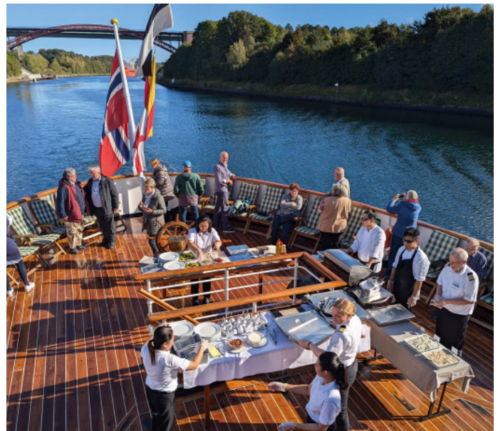
Nordstjernen Nord Ostsee Kanal BBQ

1956 bei Blohm & Voss in Hamburg gebaut, wurde MS Nordstjernen im November 2012 von der obersten norwegischen Denkmalschutzbehörde unter uneingeschränktem Denkmalschutz gestellt. Sie stellt ein besonderes Beispiel für das Schiffsdesign der 50er Jahre dar, das in vielen Bereichen noch auf Entwürfe der 30er Jahre und der Dampfschiffszeit zurückgeht.