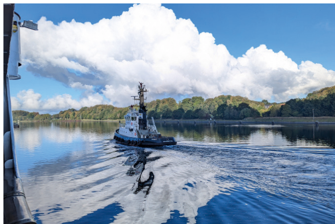
Nordstjernen Nord Ostsee Kanal